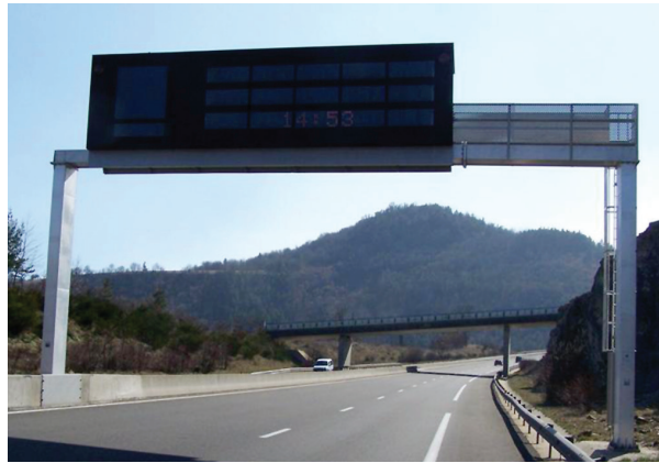
Photos 7 et 8 : Portique équipé de moyens d'accès permettant l'accès au dispositif de signalisation par PMV